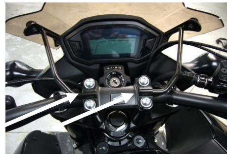
Foto 2 Schrauben die entfernt und ersetzt werden