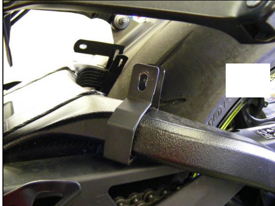
in Fahrtrichtung links